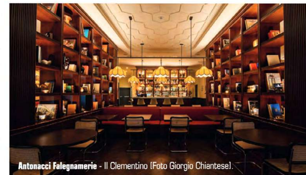
Antonacci Falegnerie - Il Clementino.

Il nuovo sito www.antonaccifalegnerie.it è già online ed è pensato come piattaforma esperienziale per scoprire la storia e i progetti dell'azienda.