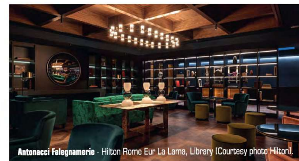
Antonacci Falegnerie - Hilton Rome Eur La Lama, Library [Courtesy photo Hilton].